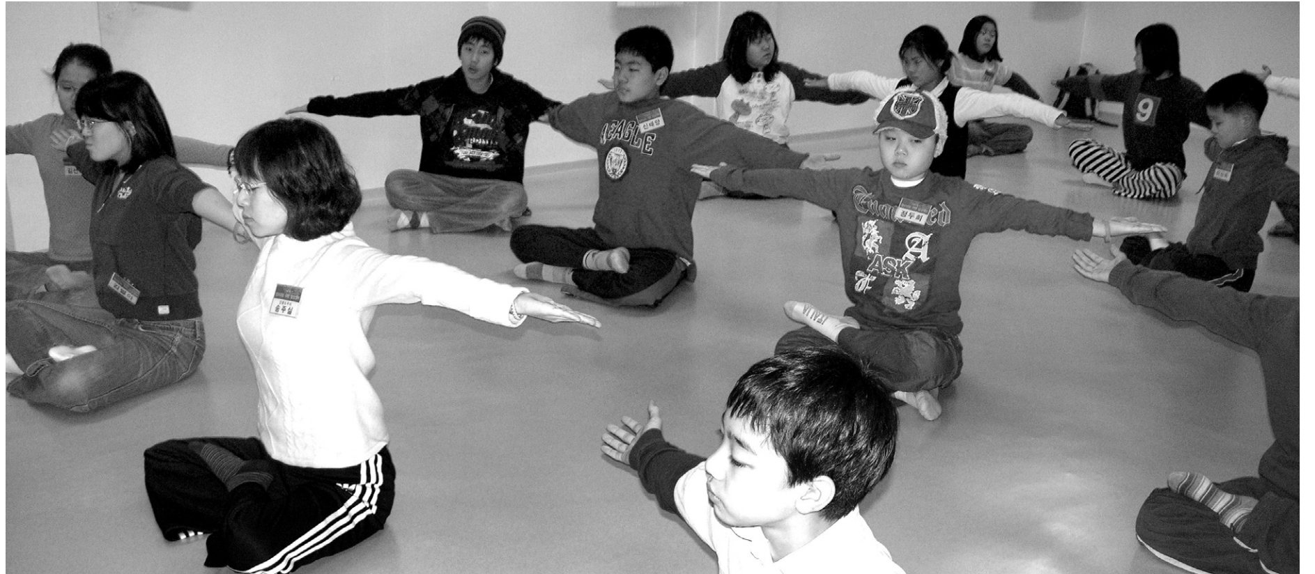
청소년들이 선체조를 하며 심신을 차유·단련하고 있다. 이런 훈련을 통하여 미디어 중독을 치유할 수 있을 뿐 아니라 학습에도 많은 효과를 얻을 수 있다.

다른 하나는 뇌와 마음의 최소기능만 가동하고 나머지는 휴식하게 하는 것이다. 이렇게 하는 방법은 알아차림 기능인 알아차림을 기준점(출발점)에 맞춰 고정시키는 것이다. 그러면 뇌와 마음은 휴식한다. 이 또