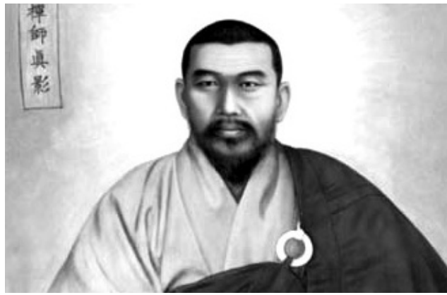
맥이 끊기다시피한 선종을 다시 진작시킨 경허선사의 영정. 스님은 자신의 파계적 삶에 대해 ‘다생의 습기이며 본능’이었음을 고백했다.

“만공, 한암도 법은 따르되 행은 따르지 말것 강조 바르지 못한 계행 후대 지계 정신 훼손 경허 평가 냉정해야”