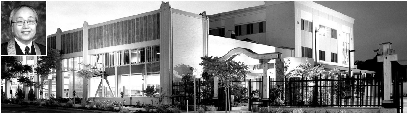
샌프란시스코에 본원을 두고 있는 미국 불교 교회(Buddhist Churches of America: BCA) 전경. 사진 왼쪽 상단은 BCA 14대 교주로 선출된 코도 우메쥬.