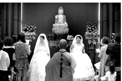
대만의 불교사원에서 여성 동성애자 커플을 위한 결혼식이 치러졌다.

대만은 동아시아에서 문화적으로 자유로운 국가 중 하나로 동성애 단체들은 수