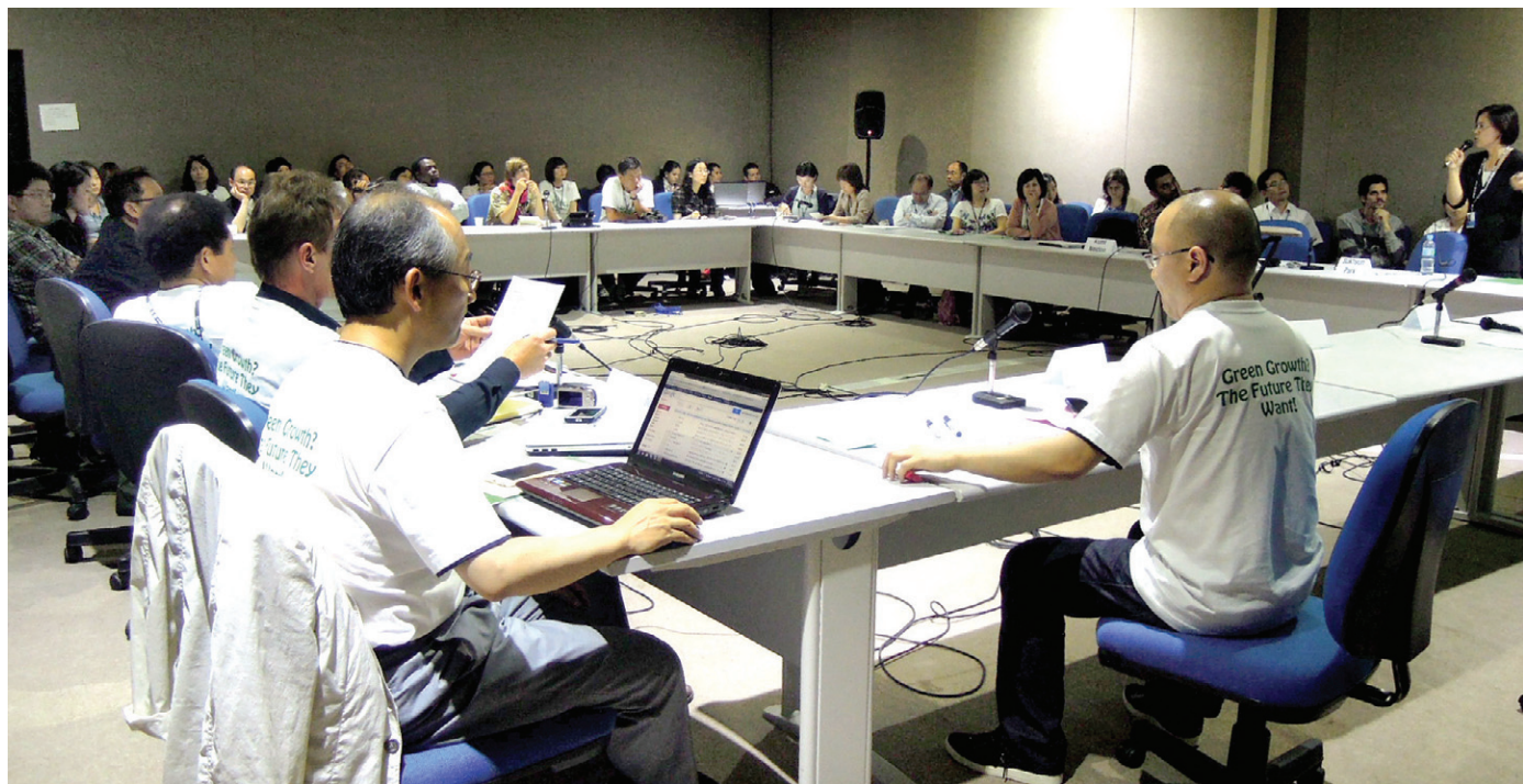
지난 6월 20일 브라질에서 열린 '리우+20' 회의(사진 위)와 같은 시기 열린 '리우+20' 민간위원회 회의 모습(사진 아래). '리우+20' 정상회의는 녹색경제의 전환을 논의했지만, 민간위원회는 이에 대한 허구성을 비판했다.

식에도 미치지 못했다는 비판이 높다. 특히 지구라는 자원의 한계에 대한 인식, 지구 수용능력의 한계, 자원 희소성에 대한 인식 부족 등 위기에 대한 절박함 없이 체계적인 진단과 원인에 대한 분석도 없었다. 구조적인 대안을 제시하지 못하면서 신자유주의적 태도를 중심으로한 경제주의만이 강조됐다는 평가이다.