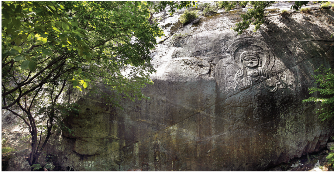
호성암터의 마애불은 큰바위 가운데에 새겨서 하늘에서 내려오는 것 같은 느낌을 준다.

답사는 남원 만복사에서 시작해 남원 개령암터와 호성암터, 완주 경복사터와 보광사터, 고창 동불암터 그리고 부안 불사의방터와 원효굴터로 이어진다. 저자는 시적인 감상으로 때로는 설화와 전설, 민담으로, 역사적 사료를 통해 절터 사라진 절터를 입체적으로 재구성하고 있다. 단순한 관찰자나 보고자가 아닌 순례자의 시선으로 옛 절터의 진면목을 찾아 보여준다. 절터는 버려진 장소다. 그 옛날에는 절이 있었을지 모르지만 지금은 '터'일 뿐이다. '있었던' 곳이다. '있었던' 곳에 지나지 않는, 차라리 없었던 것보다 못한 아쉬움의 장소인 그 곳에서 저자는 '터'만이 가지고 있는 '고요'를 찾아낸다. 인간 위주의 생각에서 벗어나 자연이 들려주는 현장의 소리에 주목