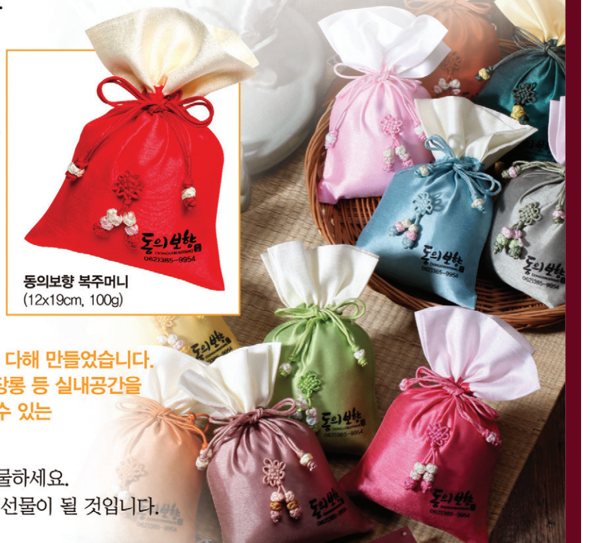
동의보향 북주머니 (12x19cm, 100g)

동의보향은 한점 한점 수작업으로 정성을 다해 만들었습니다. 동의보향은 자동차, 공부방, 침실, 거실, 장롱 등 실내공간을 은은한 향기로 가득 채워 건강까지 행길 수 있는 천연향입니다.