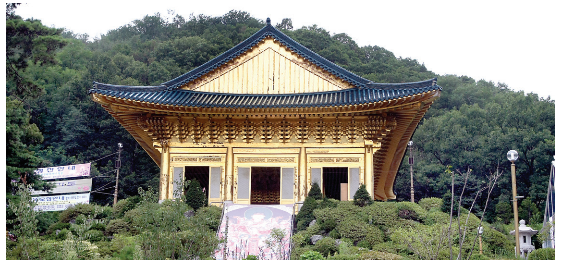
황금빛으로 늘 찬란한 수국사의 하루가 저물고 있다.