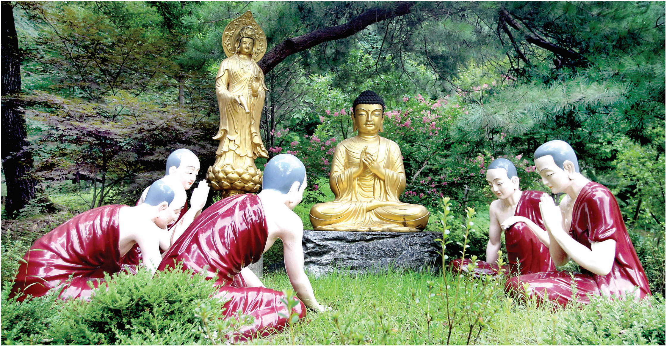
수국사 대웅전과 수각 사이에 조성된 초전법륜상. 부처님이 성도 후 5비구에게 첫 설법을 하고 계시다.

“비구들이여, 여기에 성스러운 고제(苦諦)가 있다. 태어남도 괴로움, 늙음도 괴로움, 병들음도 괴로움, 죽음도 괴로움이다. 비구들이여, 여기에 괴로움에 대한 성스러운 집제(集諦)가 있다. 이곳저곳에 집착하는 갈애이다. 비구들이여, 여기에 괴로움에 대한 성스러운 멸제(滅諦)가 있다. 갈애에서 벗어나 집착하지 않는 것이다. 비구들이여, 여기에 괴로움의 소멸로 이르는 성스러운 도제(道諦)가 있다. 곧 여덟 가지 성스러운 길을 말하는 것이니, 정견(正見), 정사유(正思惟), 정어(正語), 정업(正業), 정명(正命), 정정진(正精進), 정념(正念), 정정(正定)이다.” 부처님의 첫 설법이 들려온다. 약수터를 지나면 부처님과 5비구를 만난다. 대웅전이 바라다 보이는 곳에 초전법륜상이 모셔져 있다. 쉽게 볼 수 없는 모습이다. 아득한 그 시절을 보는 듯하다. 2500년 전 부처님 첫 설법을 듣고 있으면 황금빛의 수국사 대웅전이 보인다.