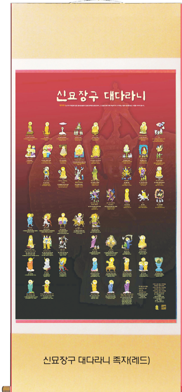
신묘장구 대다라니 족자(레드)