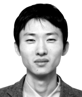
주성원의 기초 교리 <25>