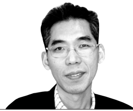
김호성 교수의 에세이 경구 ㉔