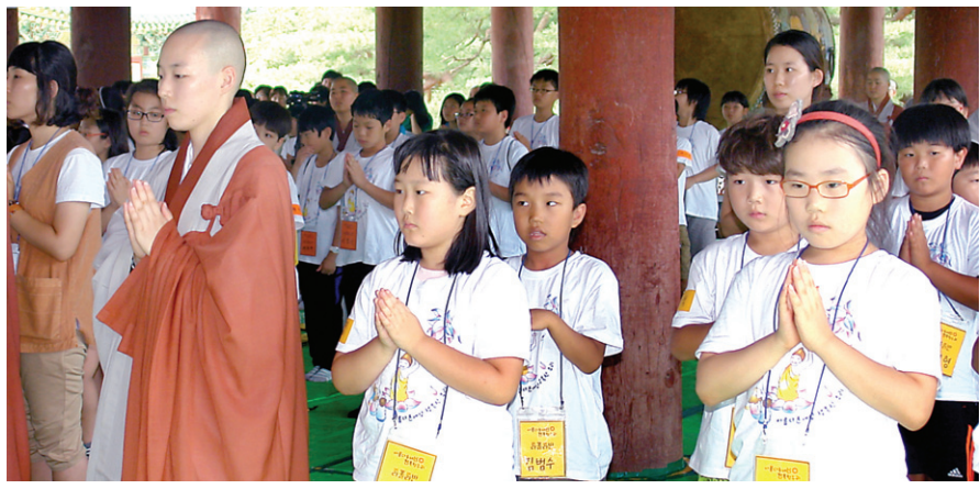
어린이 여름학교에 참여한 아이들이 입재식에서 다섯가지 은혜에 대해 생각하며 기도를 올리고 있다.