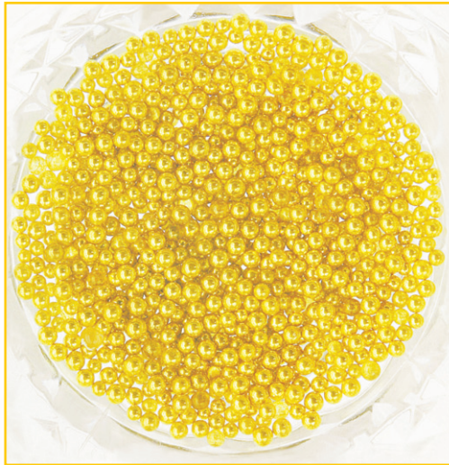
황금색의 장엄하고 화려한 부처님 혈(血)사리