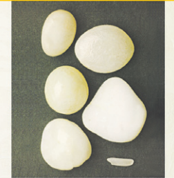
부처님의 침 사리