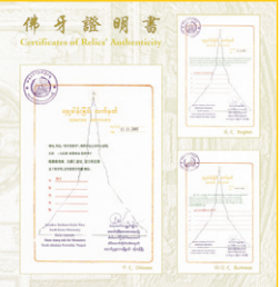
부처님의 사리 증명서