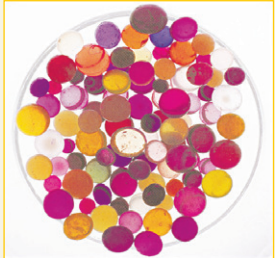
부처님의 뇌 사리