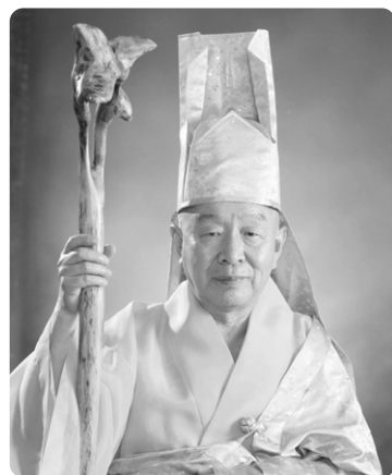
제13세 종정예하 무여당 현산

불법홍포와 수행정진에 매진하시는 제방의 청정승가와 돈독한 불심으로 삼보호지에 앞장서는 불제자 여러분들의 건승을 부처님 전에 일심으로 기원하오며 여래불교 조계종 창종을 감히 고하고자 합니다. 오늘날 혼탁한 환경을 정화하고자 정도수행, 정법포교, 평화불교를 외치고자 무여당 현산 큰스님을 초대 종정으로 받들고 어린 수행자들이 모였습니다. 여래불교조계종에 사부대중의 뜨거운 관심과 성원을 다시 한번 부탁드립니다. 교육종단, 청정종단, 열린종단을 지표로 한국불교 증흥에 앞장서는 종단을 만들어 나갈 것임을 약속드리며 여래불교조계종의 중지종풍에 함께하실 중도님들을 모십니다.