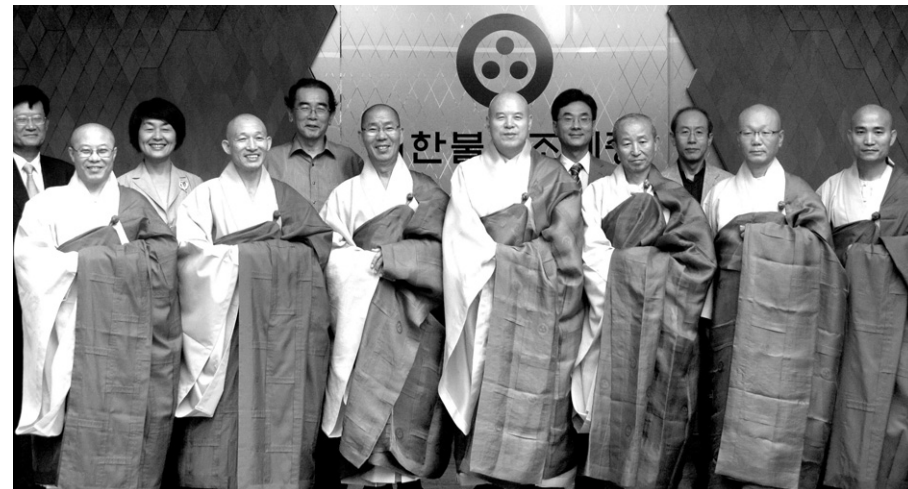
조계종총무원장 자승 스님은 7월 26일 화쟁위원회 2기 위원 위촉식을 개최했다.

‘21세기 아쇼카 선언’으로 명명된 종교평화선언은 초안을 작성해 기자회견까지