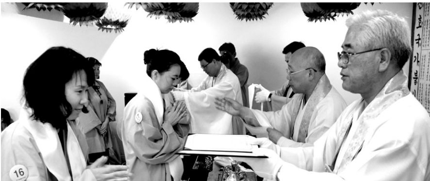
미국 LA 불광심인당서 봉행된 수계관정불사에서 25명이 아사리 정사들로부터 계첩을 받고 있다.