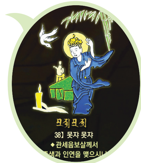
신묘장구 대다라니 족자 중의 '모직모직' 확대사진

42수 진언을 굳자 형상으로 배치하여 천수천안 관세음보살님의 위신력을 발휘하도록 하였습니다.