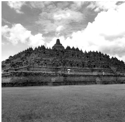
세계 최대 불교사원으로 인정받은 보로부두르 사원

인도네시아 대표적 관광 자원 중 하나인 중부 자바 마젤랑의 보로부두르 사원이 세계 최대 불교 사원으로 기네스북에 올랐다고 인도네시아 정부가 7월 5일 밝혔다.