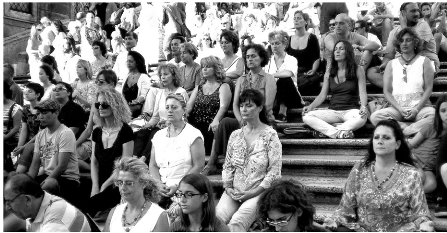
7000여 명상그룹은 1983년부터 1995년까지 총 3회에 걸쳐 대회 8~11일간 초월명상에 참여했고 결과는 테러에 관한 정보와 데이터 수집 전문 기관인 캘리포니아 '랜드(Rand)' 사(社)가 분석했다. 랜드는 "정보 수집 결과 국가 및 국제분쟁이 30% 감소했다"고 밝혔다. 사진은 그룹명상하는 참가자들

이런 현상에 대해 세계적인 양자물리학자 존 헤글린(John Hagelin) 박사는 "국가 인구 1%제공근에 해당하는 인원이 단체로 초월 명상을 하면 범죄나 폭력 등 국가의 부정적 기류는 감소하고 경제와 사회가 긍정적으로 개선된다"며 "이 사실은 희망이 아니라 지난 50년 간 현실실험에서 입증된 엄밀한 과학"이라고 강조했다. 헤글린 박사는 "이는 물리학의 마이스너 효과(Meissner Effect)로 설명할 수 있다. 초전도체(超傳導體)가 그 내부 원자들의 강력한 통합력을 바탕으로 외부에서 침투하는 모든 영향을 물리치는 현상"이라며 "수행자들이 국가의식 속에 통합력을 증가시킴으로써 테러, 분쟁, 허리케인 같은 파괴력을 물리치고 국가에 미칠 손해를 예방하는 것도 이와 같은 현상"이라고 설명했다.