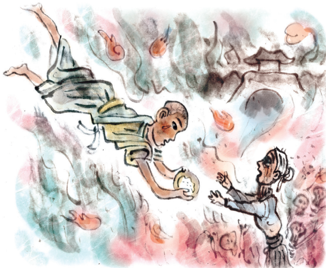
그림 · 김홍인

그때 목건련의 소리는 부처님과 비구들이 있는 사바세계 기원정사까지 두루 퍼졌다. 비구들은 이 소리를 듣고 부처님께 목건련을 다시 돌아오게 해달라고 청한다. 부처님의 명에 따라 목건련은 거인국의 5백 비구들을 데리고 기원정사로 돌아오게 된다. 거인 비구들이 너무 커서 들어갈 수 없자 목건련은 다시 신통을 부려 그들을 몸집을 줄인다. 이렇게 5백 비구는 부처님의 발에 예배하고 한쪽에 앉았다. 그때 부처님께서 거인 비구들을 향해 이렇게 설법을 하셨다.