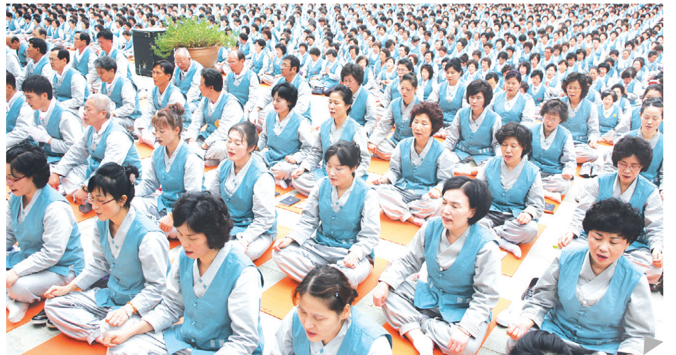
▷ 소백산 구인사 대조사전 “부산 삼광사 백만독 회향대법회” 남품사진 ◁