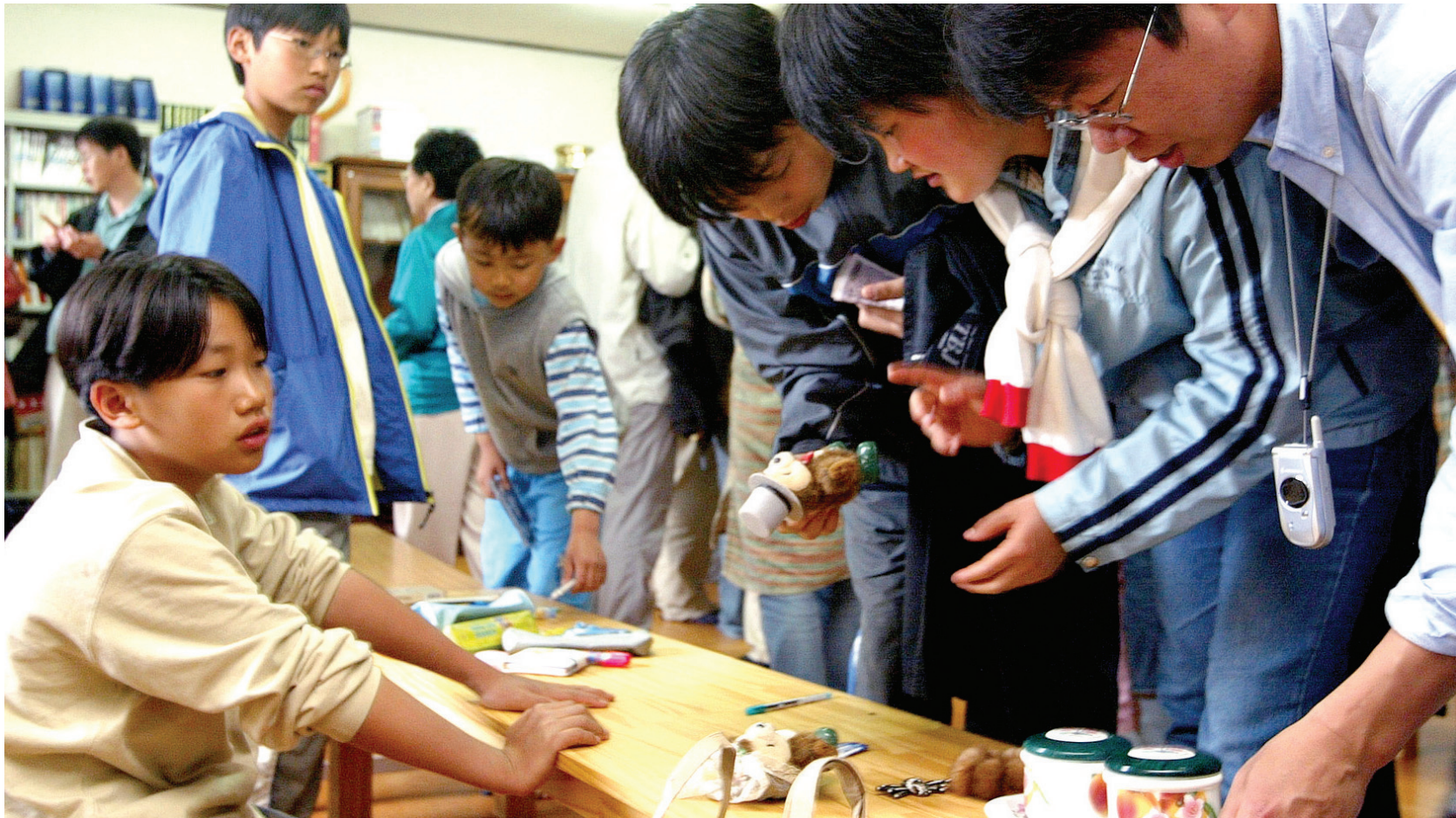
2004년 지리산 실상사 대한학교인 작은학교의 축제와 운동회 모습. 아이들은 자연과 함께 숨쉬며 세상과 어떻게 상생해 나갈것인지를 스스로 배운다. 무한경쟁사회의 ‘죽임의 교육’에서는 도저히 알 수 없는 것들이다.

교훈적 내용인 이 우화를 시작으로 우리에게 끊임 없는 경쟁적 삶이 펼쳐진다. 보이는 보이지 않는 경쟁에 내몰리는 것이다. 특히 학교교육은 1등에서 꼴찌까지 이어지는 시험과 입시경쟁, 취업경쟁 등 모두 경쟁이다. 죽을때까지 경쟁 하는 것이다. 경쟁은 곧 이기고 지는 게임이며, 내가 이기기 위해서는 누군가는 져야 한다. 누군가의 실수는 곧 나의 이익이다. 주요한 것은 이러한 경쟁에 대한 인식의 기본 토대는 나와 상대를 철저히 구분하고 가르치는 인식에서 출발한다. 이러한 인식은 우리 삶의 모든 것을 전투화 한다. 싸움이기 때문에 결국 이기고 지는 문제로 보는 것이다. 일상적으로 용기를 북돋는 말까지도 ‘화이팅(싸워라)’이라고 한다. 이러한 승리 전략은 우리 삶의 곳곳에 짙고 교묘히, 세세하게 배어 있다.