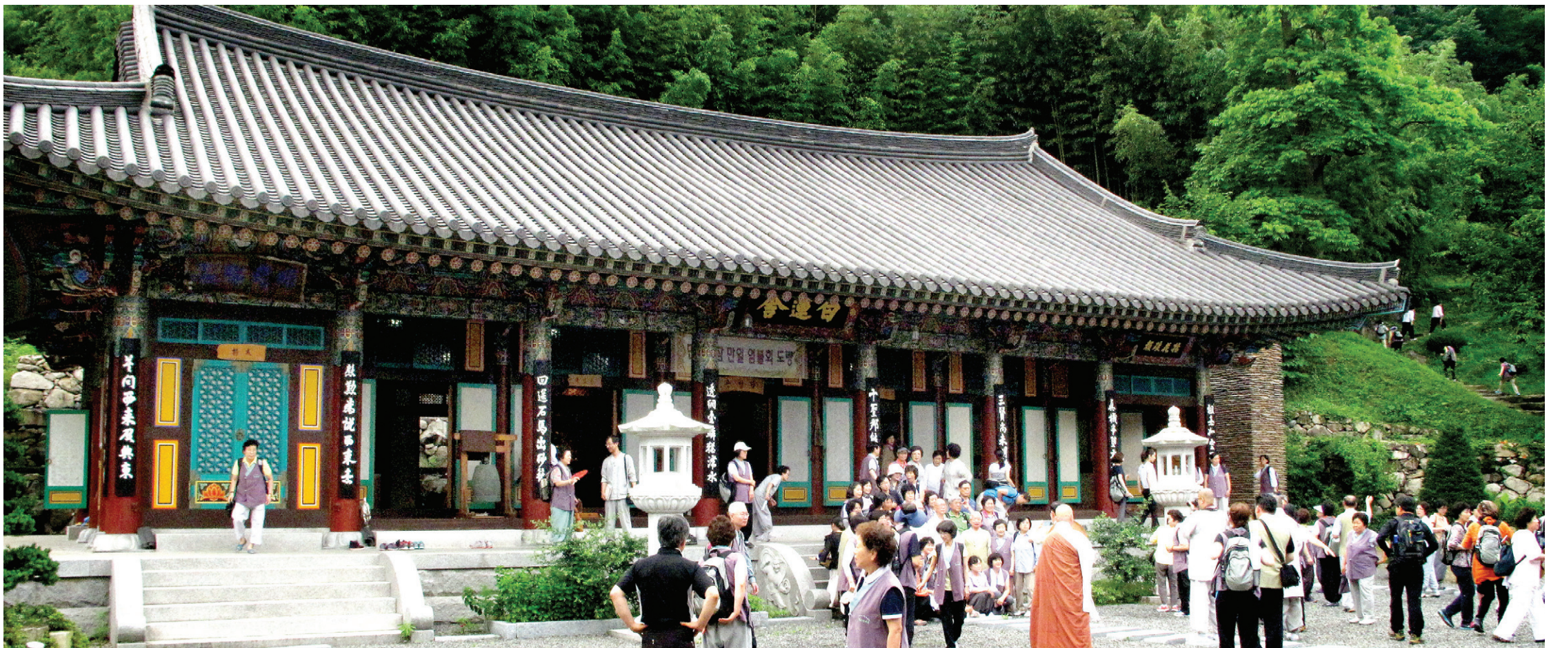
성철 스님이 통도사 백련암에 머무르던 시절, 통도사는 1900년 경허 스님이 직접 통도사로 와서 선종을 떨치던 때였다. 순례단원 340여명은 백련암에서 참배를 마치고 스님이 주석하던 요사채를 둘러보며 법향을 느꼈다.