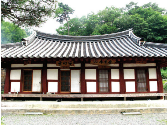
성철 스님이 1938년 동안거를 보낼때 머물던 요사채.