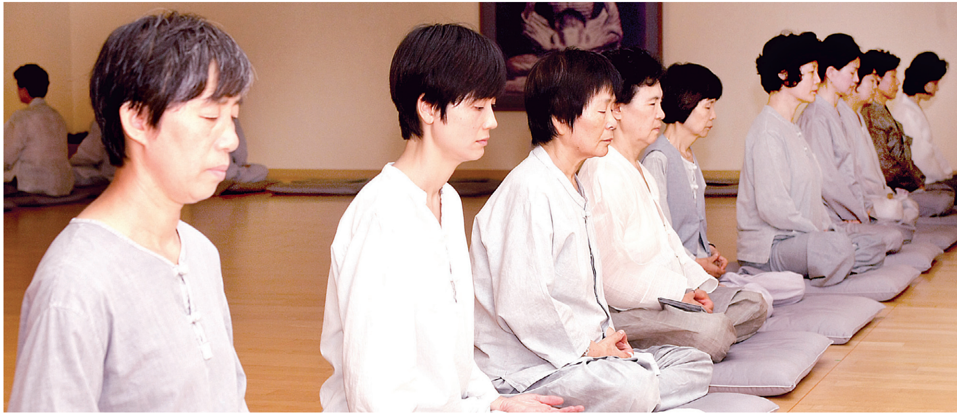
염천의 더위에도 재가자들의 수행열기는 뜨겁다. 봉은사 봉은선원에 방부를 들인 재가자들이 이른 아침부터 참수 수행을 하고 있다.