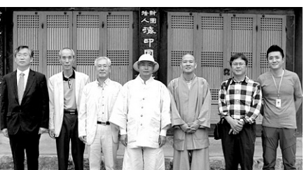
동아대 석당학술원과 해인사는 16일 연구협약을 맺었다.

사업에는 경판 관련 전문가인 역사·서지학자, 금속성분 및 제작기법을 분석할 보존과학자, 목판의 판각기법 및 목질 등에 대한 수리복원 전문가 등 3개 영역에