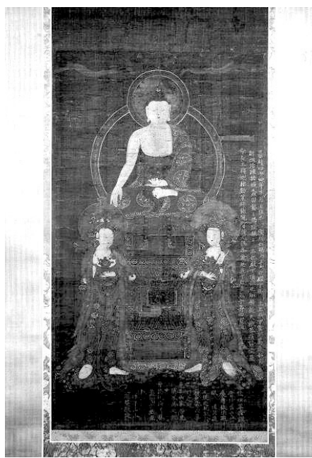
미국에서 지난해 최초 공개된 회암사 석가삼존도

양주 회암사 박물관측은 7월 27일 개관에 맞춰 미국 버크 컬렉션의 석가삼존도 임대 전시를 추진 중에 있다. 양주 회암사