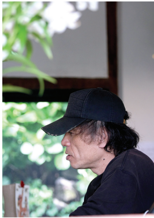
아난다를 통해 본 부처님 시나리오지만 영화 안 만들어도 괜찮아

이번 시나리오는 영화화를 우선으로 하지 않았다. 그래서 ‘읽는 시나리오’라는 이름이 붙었다. ‘일체는 조건에 따라 생겨나고 사라질 뿐이라고 그분은 가르칩니다. 이것이 있으므로 저것이 있는 것입니다. 다행이 영화화 되더라도 내가 꼭 해야 한다는 생각이 없습니다. 적당한 누군가 범담계 잘할까 바랄 뿐입니다.’ 2005년, 영화 ‘천개의 고원’이 중단되자