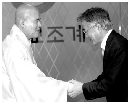
문재인 민주통합당 고문이 7월 18일 자승 스님과 악수를 나누고 있다.

이어 문 고문은 최근 사찰들을 방문했던 일화를 소개하기도 했다. 문 고문은 “대선 출마 선언 후 대응사에 가니 너무 환대해줘 감사했다. 늘 불교계에는 고마움을 가지고 있다”며 “어제에는 전주 잠봉은우리절에 방문했는데 ‘국민죽비’라고 쓰여진 선물을 주셨다. 항상 국민의 경책들을 옆에 두고 최선을 다하겠습니다”고 말했다.