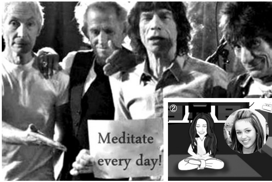
① 명상 옹호론자로 나선 미 재계(오른쪽에서 두번째) ② 자신을 주인공으로 온라인 명상게임을 만든 마일리 사이러스 ③ ‘어벤져스’의 크리스 에반스

헐리웃스타와 해외 유명뮤지션, 그리고 유명인사들은 대중들로부터 화려한 인기와 시선집중을 한 몸매 받는다. 때문에 그들의 삶 이면에는 개인적 고독과 정신적 스트레스, 불안한 가정 문제 등이 있기 마련이다. 이들은 스트레스를 해소하고 연기 활동에 필요한 집중력 등을 얻기 위해 종교 활동에서 위안을 찾는다. 특히 미국과 유럽 등 서구지역에서 명상수행을 비롯한 불교 및 동양철학을 주도하고 있다. 여기에 비슷한 문제들을 안고 있는 대기업