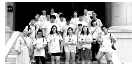
조계종 미국 동부 교포 청소년문화체험단은 7월 9-16일 서울 조계사 등 전국을 순회하며 한국문화를 체험했다.

미국 동부 교포 청소년들이 한국의 불교와 문화를 체험하는 시간을 가졌다. 조계종 아동부 해외특별교구(교구장 휘광) ‘청소년 한국문화체험연수단’은 7월 9-16일 7박 8일 간 서울 조계사, 경주 골굴사 등을 방문하고 한국문화와 불교문화를 체험하는 행사를 진행했다. 첫째 날에는 인천 용화사에서 참선 체험을 했으며, 이후에는 조계사 참배, 불교중앙박물관 소장 유물 관람이 이뤄졌다. 이와 함께 경복궁, 국립중앙박물관을 비롯해 경주 불국사 참배, 원효대사 유적지 관람, 골굴사 선무도 체험, 해안사 야외참