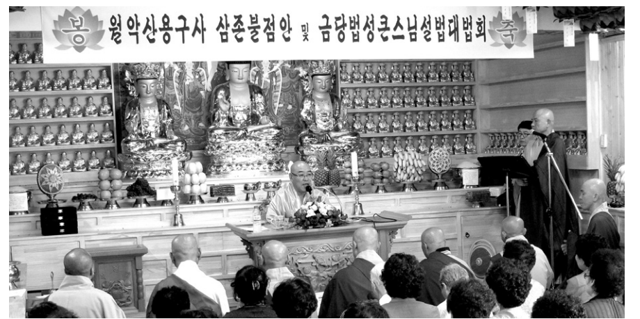
제천 용구사는 7월 17일 삼존불 점안식 및 금당법성 큰스님 설법대법회를 봉행했다.

월악산 제천 용구사(주지 지우)는 7월 17일 삼존불 점안식 및 해수관음상 조각도 커팅 법회를 봉행했다.