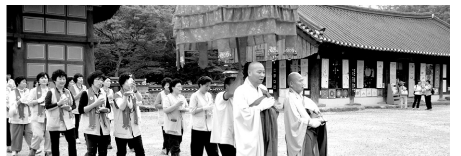
마음으로 찾아가는 108산사 순례단이 7월 15일 4년만에 선운사를 방문해 참선, 108배, 사경 등을 실시했다.

마음으로 찾아가는 108산사 순례단(단장 혜자스님)은 7월 15일 4년 만에 전북 고창 선운사(주지 범만)를 찾았다. 장맛비가 내리는 곳엔 날씨에도 불구하고 약 1600여 명의 불자들은 2008년에 이어 2번째로 선운사를 방문했다.