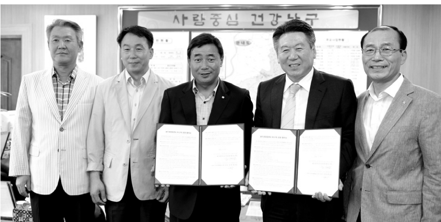
저절로 생협은 광주콩종합센터 위탁업체로 선정돼 7월 18일 협약식을 체결했다.

저절로생협은 향후 2년간 ▷콩(장류)산업의 육성 ▷교육 및 훈련 ▷연구개발 및 신기술 보급 ▷생산판매 및 창업지원 ▷요리 및 공예보급 ▷문화예술·교양사업 등을 담당하게 된다. 저절로생협 담당자는 "향후 시민들에게 건강한 먹거리