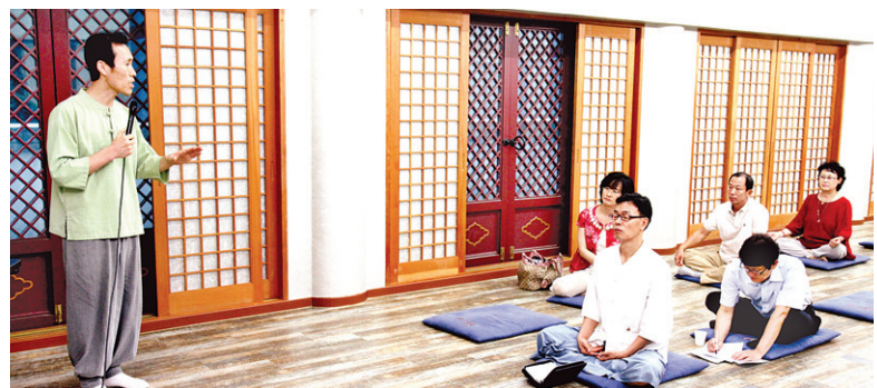
조계사 '마인드케어' 평생교육원의 '도시 마을 공동체 만들기' 강좌. 급증하고 있는 평생교육 수요에 맞춰 불교계도 특화된 교육센터를 운영해야 한다는 목소리가 높다.

평생교육에 대한 관심이 나날이 높아지고 있다. 정부 역시 평생교육법을 제정해 국민들의 평생교육을 유도하고 있고, 종교단체까지 평생교육시설을 설치할 수 있도록 하는 방안도 추진 중이다. 불교계도 변화하고 있는 평생교육 시장에 대한 대책을 마련해야 한다는 목소리가 높다.