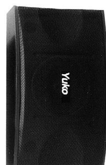
• 특징 : 자체 제작하는 스피커로 소리가 웅장합니다. 핀 마이크와 잘 맞습니다.