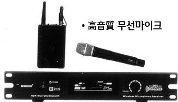
• 高音質 무선마이크

스님께서 사용중인 ‘무선-핀 마이크’를 高性能 ‘헤드셋 마이크’로 개조 해 드립니다. (빠- 소리없이 웅장하고 맑은 소리를 책임지겠습니다.)!!