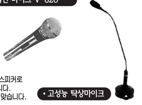
• 고성능 탁상마이크