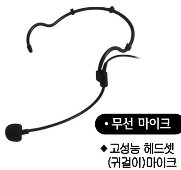
• 무선 마이크 • 고성능 헤드셋 (귀걸이)마이크