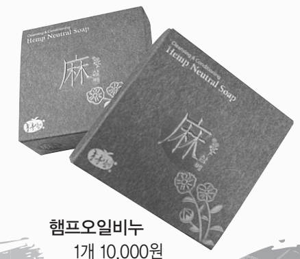
햄프오일비누 1개 10,000원

사위타올, 세안타올, 수세미 3종 세트 27,000원 (2set 이상 주문시 배송비 무료)