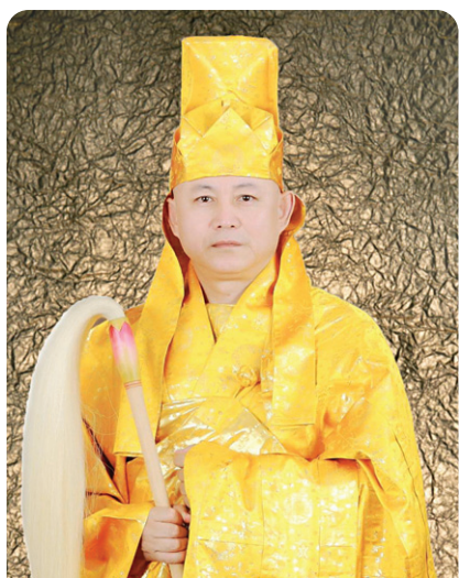
석가여래부촉법 제 77제 청봉 석정산 대중사