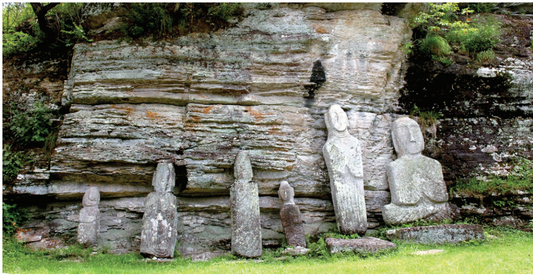
억겁의 시간을 기다려 천불천탑이 되고 다시 미륵불이 오기를 기다리고 있는 운주사의 석불들

“인간이란 태어나 괴로워하다가 죽는 것.”으로 시작되는 책은 부처님의 이야기로 시작된다. 부다는 ‘태어나고 죽는 것’에 대한 의문을 풀기 위해 모든 것을 버렸고 또한 답을 찾았다. 하지만 지금의 우리는 부다처럼 삶의 불가사의를 풀기 위해 애정, 권력, 부, 쾌락, 가족의 따뜻한 유대를 끊어버리지는 못한