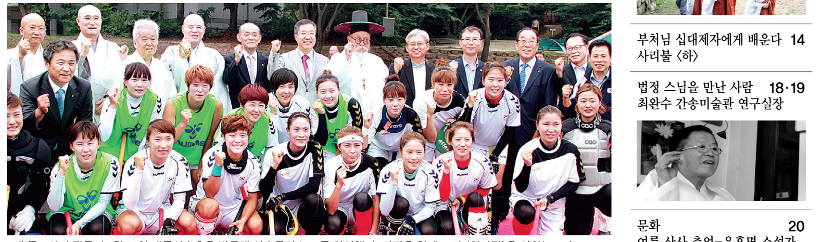
7개 종교의 수장들이 7월 10일 태릉선수촌을 방문해 선수들의 노고를 치하했다. 사진은 함께 모여 '화이팅'을 외치는 모습

위)을 목표로 하고 있다. 금메달 후보 선수 중 불자선수들이 70~80%를 차지하고 있다"며 "금메달 획득과 더불어 불법을 널리 호포할 수 있도록 최선을 다하겠다"고 밝혔다. 포교원장 지원 스님은 법에서 "몸은 마음가짐대로 따라가기 마련이다. 인간의 능력은 무한하다. 올림픽에 앞서 부처님 가피로 마음가짐을 굳건히 해 선수들이 국위선양에 이바지하길 바란다"고 당부했다. 3면에 계속