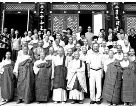
이날 문담에는 60여명의 수행자들이 참여했다.