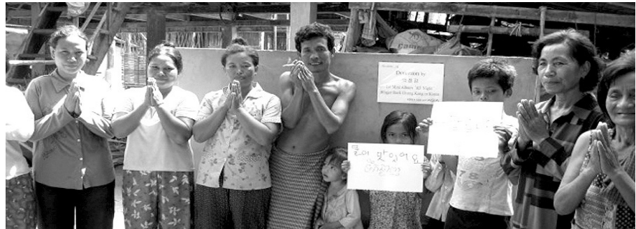
백정강 팬들의 후원금을 지원받아 우물을 짓게 된 캄보디아 주민들이 감사인사를 하고 있다.

위드아시아는 국내를 비롯해 아시아 지역 빈곤·소외계층을 국제구호 비영리 법인으로 2011년 2월 통일부로부터 ‘사단법인 위드아시아’로 명칭변경을 승인받았다.