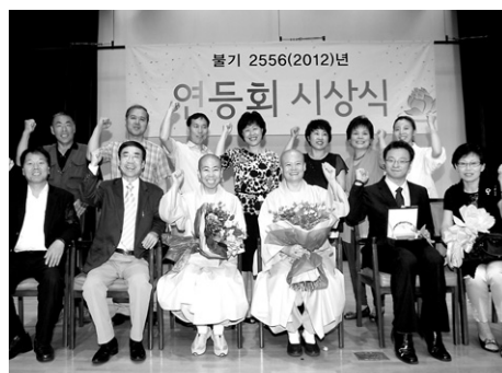
2012년 연등축제 시상식에서 한마음선원 청년회는 정진상을 수상했다. 10여회의 연이은 수상이다.

“순수한 신심과 열정으로 장엄등을 만들었기 때문에 상을 받은 것 같습니다.” 부처님오신날봉축위원회(위원장 자승)는 7월 6일 한국불교역사문화기념관에서 '2012 연등축제 시상식'을 봉행했다. '2012년 연등축제 시상식'에서 한마음선원 청년회가 정진상을, 서지연 법우가 표창패를 받았다. 한마음선원 신도단체가 봉축위로부터 연이어 상을 받은 지도 벌써 10여 회가 넘는다.