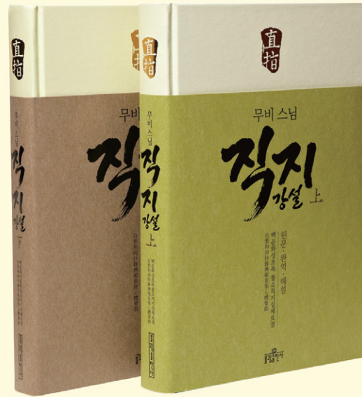
무비 스님 저음! 양장본 상 448쪽 하 424쪽 | 가격 각 23,000원

『직지』의 원제목은 『백운화상초록불조직지심체요절』이다. 백운 화상이 부처님과 조사스님들이 바로 가리켜 준 마음을 깨닫는 중요한 가르침을 가려 뽑음이라는 제목에서 엿볼 수 있듯 이 책은 선불교 최고의 교과서이다. 무비 스님은 직지 강설을 통해 선불교 禪佛敎의 핵심을 꿰뚫어 보여준다. 무비 스님이 늘 강조하는 인불사상人佛思想, 사람이 부처님이라는 가르침이 곧 선불교의 핵심임을 천명하고 있다. 바로 지금 이 자리에서 마음을 알아치르면 그대로 깨달은 존재, 사람이 부처님임을 알게해주는 가르침에서 새로운 희망을 갖게 된다.