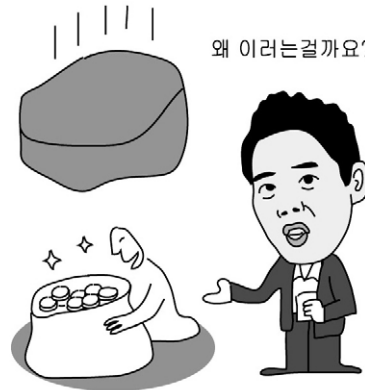
그림 · 박구원

개그맨 황현희는 큰 웃음을 유도하지만, 부처님은 큰 성찰을 요구한다. 우선 자식이나 가족이나 어여쁜 꽃이나 그 무엇이든, 그것을 향한 우리의 집착이 이내 닥쳐올 죽음을 감안하더라도 의미 있는 것인지를 물어보아야 한다. 죽음의 힘이라 하더라도 다 무화(無化)시킬 수