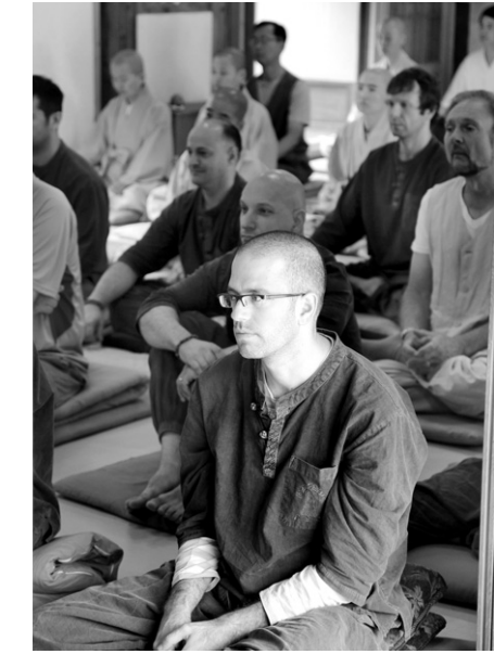
세계 불교석학들이 6월 25일부터 7월 1일까지 마곡사에서 간화선을 실천했다.