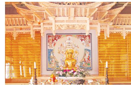
영주사 LED 인등

찬덕연등이 개발한 새로운 개념의 신상품 영구위패 · LED 인등 · LED 전구