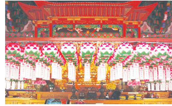
연등 자동 승강장치 - 흥은사

전선(케이블) 연등승강장치 天上列車 ※이제는 범당 연등 설치도 버튼 하나로 해결하세요.