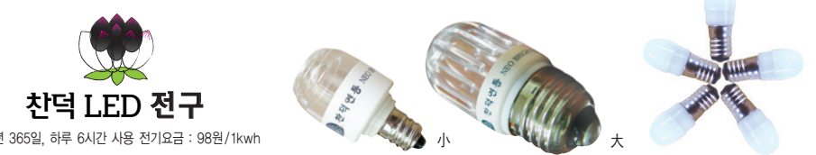
찬덕 LED 전구