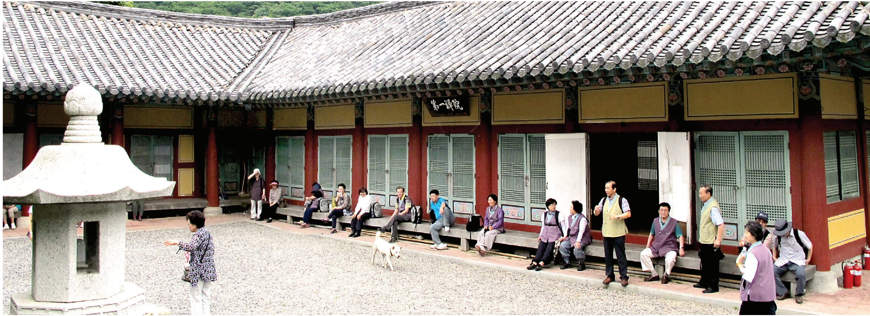
성철 스님이 20대에 한 철 정진을 했다는 범어사 내원암 전경. 이곳에서 스님은 용성 스님을 만나기도 했다. 성철 큰스님 탄생 100주년 기념 순례단의 순례객들은 6월 23일 범어사를 찾아 법회를 열고 내원암을 둘러보며 성철 스님의 자취를 느꼈다.