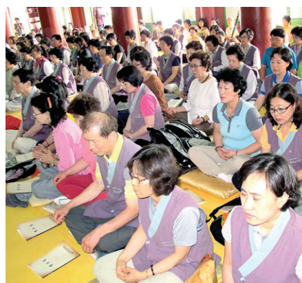
설법전에서 법문을 듣고 있는 순례자들