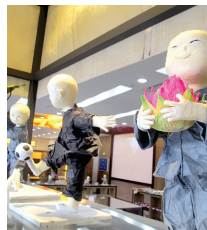
템플스테이 홍보관의 동자승 시리즈