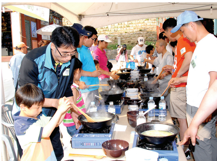
사찰이 지역민을 위한 사찰음식 축제를 개최해 자연 음식과 환경의 중요성을 일깨워주고 있다. 사진은 지난 6월 16일 개최된 진관사 사찰음식 시연회 장면.