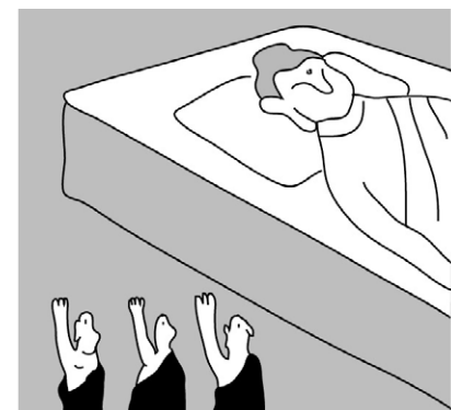
그림 · 박구원

부처님께서 아시고 계셨다. 창업보다 수성이 어려움. 그래서 그러한 대임을 맡길 어느 한 사람의 후계자를 간택하여, 수성의 대임을 맡기시지 않으셨