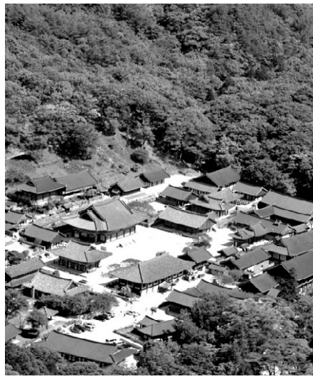
조계종 제21교구본사이자 승보사찰인 송광사 전경

송광사, 선암사가 자리하고 있다. 송광사도 신라 해린대사 창건이후 보조국사를 비롯한 16국사를 배출한 승보총찰의 종찰로 116여 동의 건물을 보유하고 있으며, 송광사 국사전 등 35점의 지정문화재와 2만여 점의 동산 문화재를 보유하고 있는 한국 불교의 대표적 사찰이다.