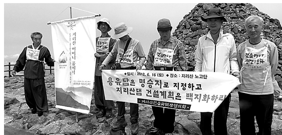
생명평화결사는 6월 16일 지리산 노고단에서 지리산댐 건설계획을 반대하고, 용유담을 명승지로 지정하라고 촉구했다.

생명평화결사는 이번 행사에서 “2001년 국민운동으로 막아냈던 지리산댐 건설계획이 합양군과 정부의 계속된 밀실야합으로 진행되고 있다. 지리산 일대 4곳 지자체가 국립공원 케이블카 시범사업 유치를 위해 힘겨루기를 하고 있다”며 “어머니 같은 지리산을 생명평화운동의 성지로 지켜낼