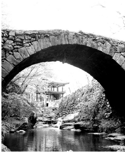
건축미가 돋보이는 아치형 다리를 간직한 선암사 승선교

또한 선암사는 백제시대 아도화상이 창건한 사찰로 31본산의 하나이며 현재 46여 동의 건물과 3000여 동산 문화재를 보유한 태고종의 총본산이기도 하다. 순천시는 조계산 송광사·선암사의 세계 문화유산 등재 외에도 낙안읍성 문화유산과 순천만(서남해안 갯벌) 자연유산의