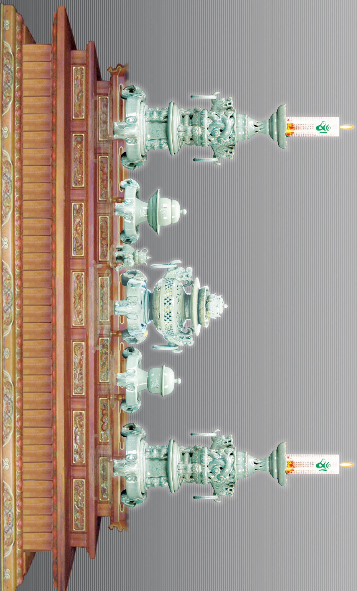
엄장소멸법륜대 세상을 바꿔!

양나라 때 선혜대자 부협 환풍으로부터 제작, 대정17년 고려 명종에 건립, 그리고 데메트 사원에지는 법륜대에 경전과 소원을 비는 글을 넣고 돌리면 소원을 이룬다고 기록되어 있습니다.