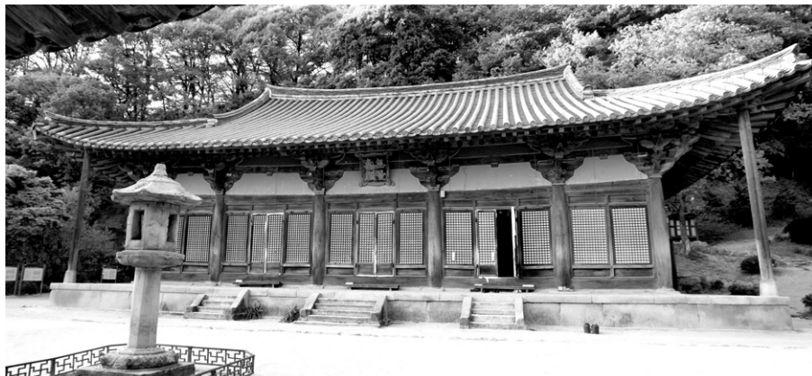
배출림 기둥은 그리스 신전처럼 안쪽이 빈 경우에만 시각 보정효과를 준다. 사진은 영주 부석사 무량수전(국보 제18호)

예를들면 이렇다. 사찰 입구에서 수호신 역할을 하는 사천왕은 무관복장을 하고 당당한 기품을 보이는데 불교우주론에 따르면 사천왕은 왕이기 때문에 무관복장을 하지 않는다고 설명한다. 또한 사천왕은 천하의 악에 대한 제압을 상징한다는 의미에서 악귀를 밟고 있는데 우리나라의 북쪽지방에서는 이 악귀가 청나라 만주족으로, 남쪽에서는 일본인으로 묘사된다는 것이 다. 그동안 사천왕만 봤지 밟아 밟아 악귀