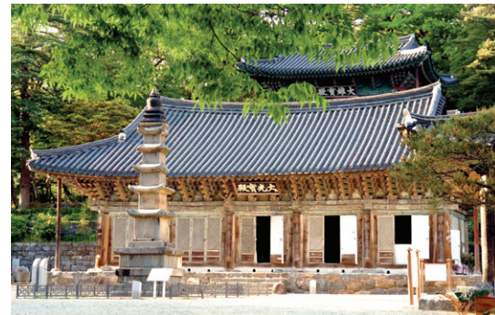
보물 799호인 마곡사 5층석탑과 보물 802호 대광보전, 보물 801호인 대웅보전이 나란히 서있다.