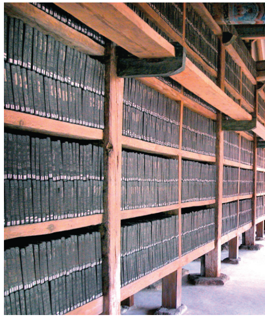
해인사 장경각에 보관된 팔만대장경 경판

라자와 시리마는 하늘 구도자로서 인간계에 내려와 부처님의 특별한 제자가 되고, 부처님의 말씀에 따라 출가하기 전 사계야구의 왕(부처님이 출가함으로써 비게 된 태자 자리를 이어받아 왕이 된 사람)이었던 밧디야를 만나고, 밧디야는 자신의 스승인 부처님의 수제자 사리뱃따 마하테라에게로 간다. 그 사