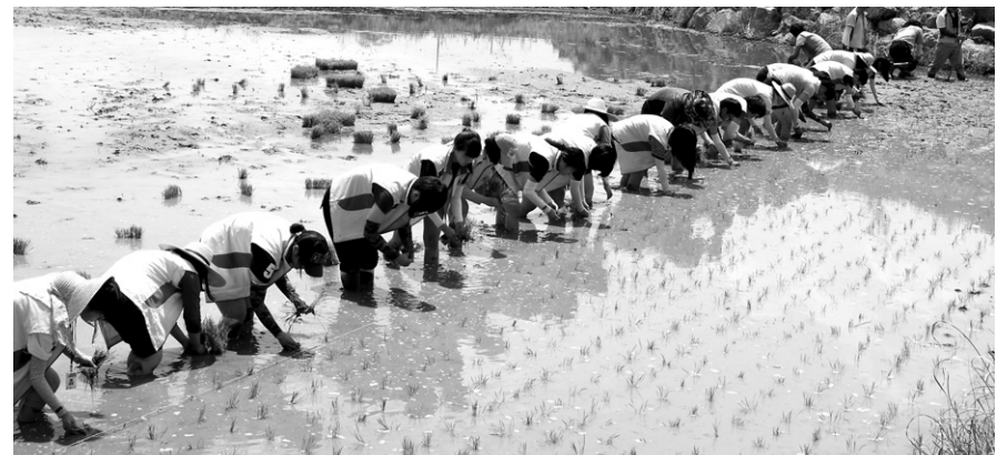
전북 남원여고를 비롯한 10여 학교의 40여 청소년들이 생명농사의 소중함을 깨닫기 위해 모심기 체험을 하고 있다.

9대 총무원장에 경원스님을 비롯 중앙총회의장 법선, 호계원장 법성, 교육원장 법해, 포교원장 도안, 감사원장 석성, 선거관리위원장 동철, 총무원부원장 용운 스님을 신임 임원으로 선출했다.