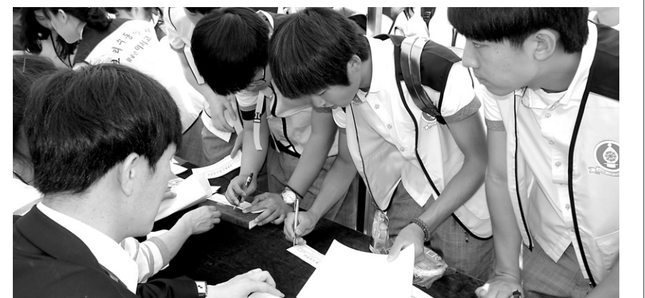
전국 청소년 무일문학상 백일장에 참가한 학생들이 신청서를 작성하고 있다.

한국불교대학 대관음사 부설 무일학원이 주최한 ‘전국 청소년 무일문학상 백일장’이 6월 3일 경북 청도 ‘참좋은이서 중·고등학교’에서 개최됐다. 이번 행사에서 개최된 ‘무일문학상 백일장’은 올해부터 전국 단위 청소년 백일장으로 열렸다.