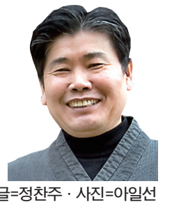
글=정찬주 · 사진=이일선

안개가 낀 이른 아침인데도 순례자들이 찾아와 부처님을 상징하고 있는 스투파를 참배하고 있다. 스투파 옆에는 공작 야자수들이 참선을 하듯 곳곳한 자세로 서 있다. 마치 부처님을 따르던 제자들이 화현한 듯한 모습이다. 생과 사를 초월하는 스승과 제자들의 아름다운 풍경이다. 진리의 세계에서는 생사가 돌아 아니라고 하나라는 사실이 깨달아진다.