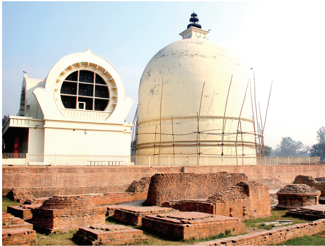
열반상이 모셔진 열반당(왼쪽)과 아쇼까왕 스투파(오른쪽). 아쇼까왕의 스투파나 석주가 없었다면 부처님 성지도 인도 역사 저편으로 사라져버렸을지도 모를 일이다.