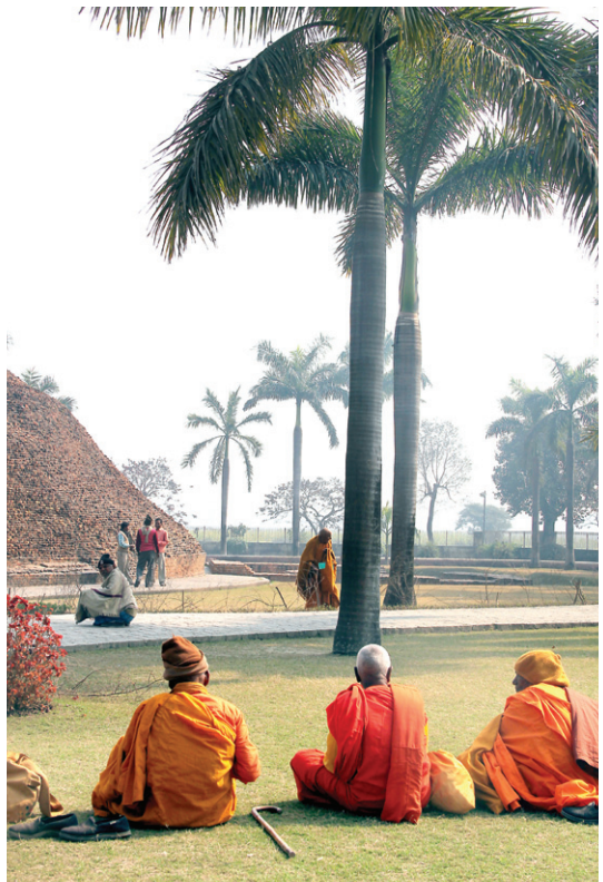
인도 스님들이 부처님을 화장한 다비장 스투파 옆에서 수행하고 있다.

"세존이시여, 왜 이렇게 작고 외진 마을의 변두리에서 열반에 드시려고 하는 것입니까? 부디 그만두십시오. 이런 작은 쿠시나(현 쿠시나गर) 마을이 아니라도 찬바나, 라자그리하, 사왓타, 사계따, 꼬삼베, 바라나시 같은 큰 마을이나 도시가 있지 않습니까? 세존이시여, 도시나 큰 마을에서 열반에 드시는 것이 좋을 것 같습니다. 도시나 큰 마을에는 왕족의 큰 집회장과 브라만의 큰 집회장, 부자의 큰 집회장이 있으며, 세존께 존경하는 마음을 품고 있는 이도 많이 있으므로 세존께서 보여 주실 사리도 정성을 다해 수습하지 않겠습니까?"