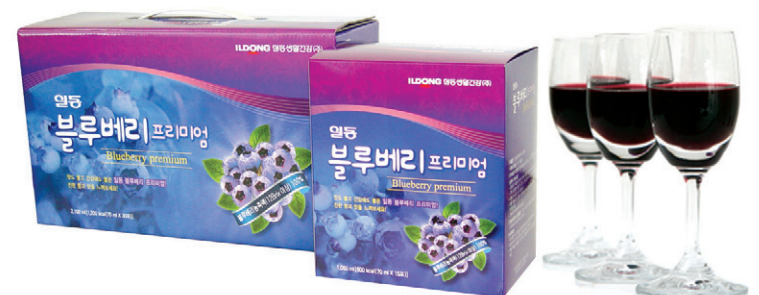
■ 제품명 : 일동블루베리 프리미엄 ■ 내용량 : 70ml×150포