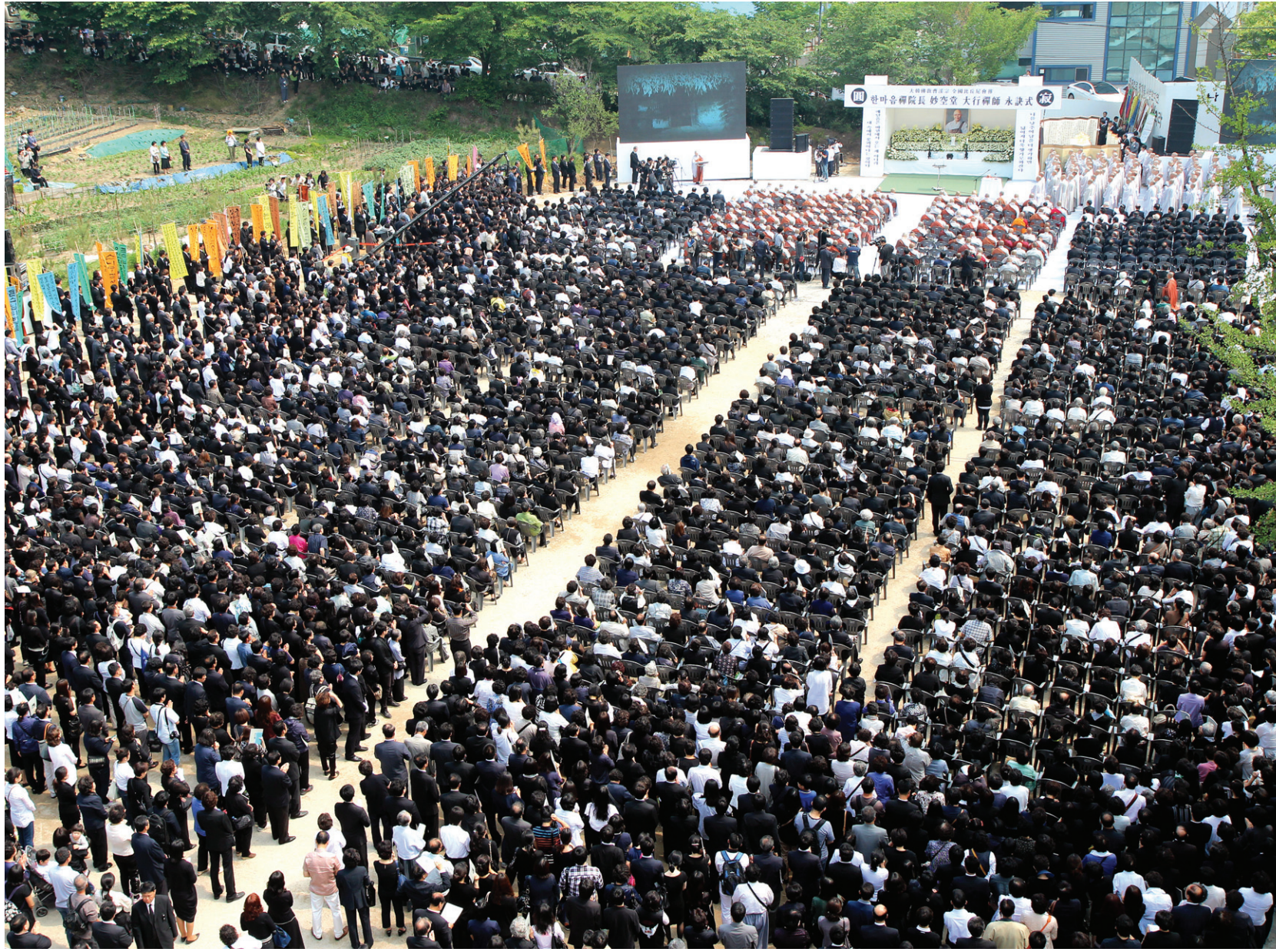
영결식장에는 3만명에 달하는 사부대중이 운집했다. 참석 대중은 저마다 스님이 남기고 가신 가르침을 되새기며, 큰 행원을 기렸다.