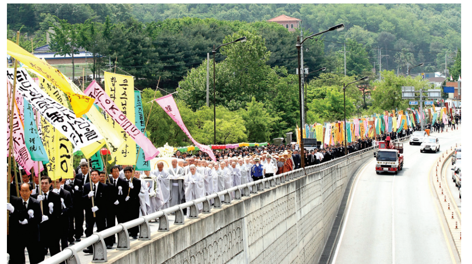
인로왕반을 선두로 대행 스님의 가르침을 기리며 추모하는 1천여 만정의 행렬이 끝없이 이어졌다. 이날 법구 이운은 안양경찰서의 협조로 질서정연하게 봉행됐다.