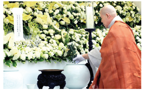
조계종 총무원장 지승 스님이 헌화하고 있다.