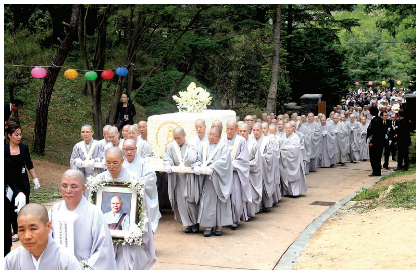
운구가 스님의 주석처인 서산정에 도착했다. 다비식은 서산정 앞마당에서 진행됐다.

“내가 죽는다 산다는 생각 없이 그냥 놓고 간다면 그것이 벗어나는 길입니다”