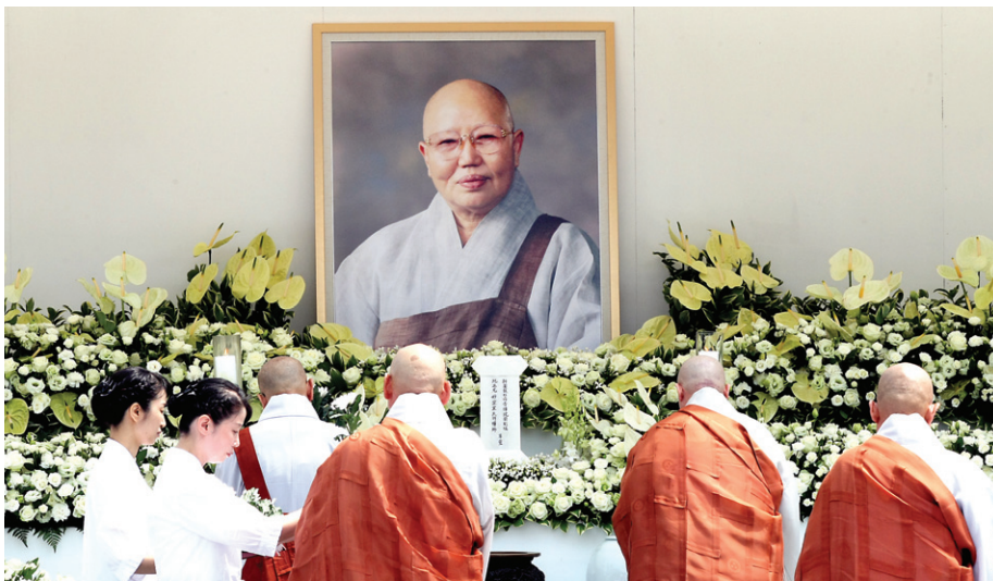
대행 스님 영전에 각계 인사들이 추모의 헌화를 하고 있다.