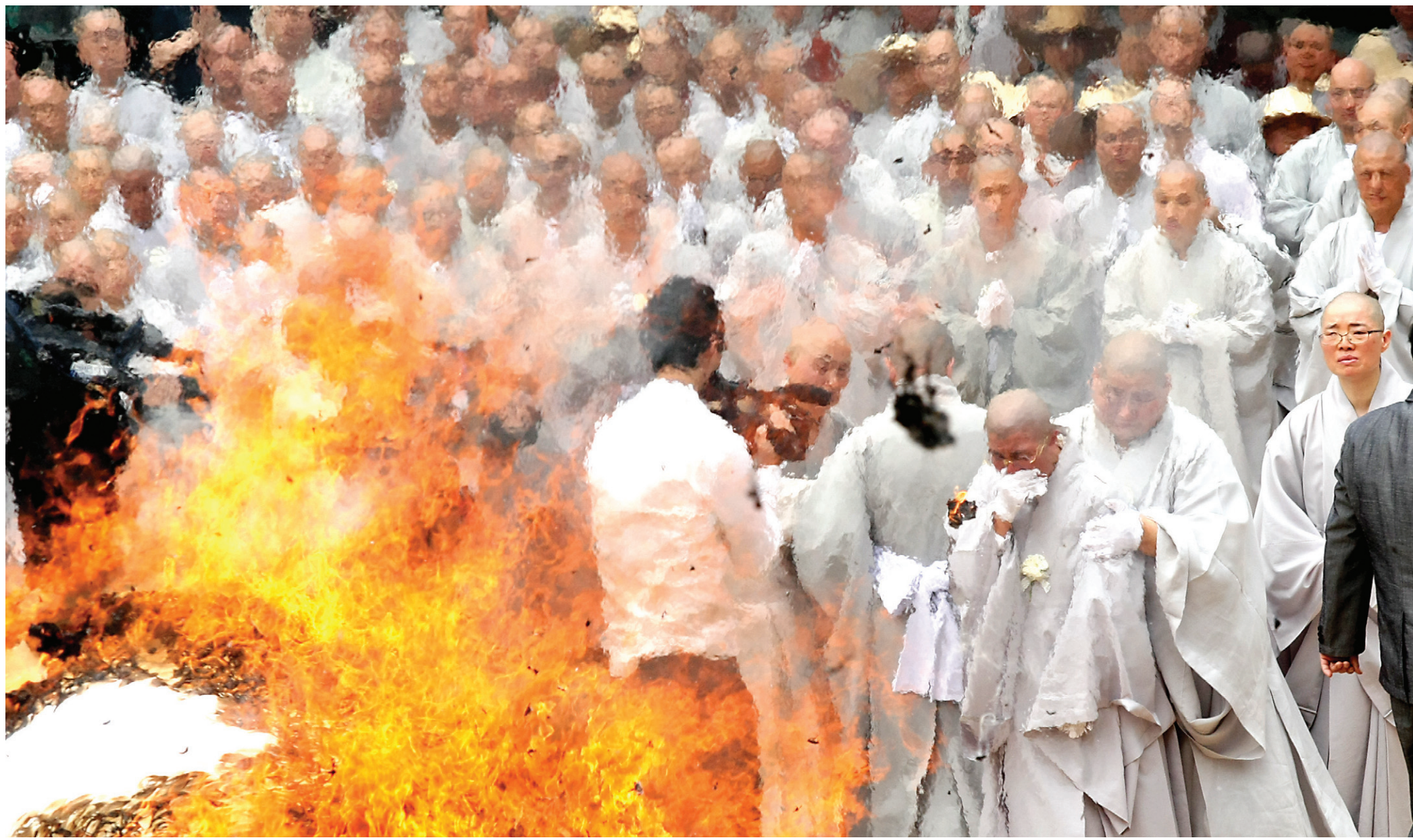
“스님, 불들어 갑니다. 어서 나오세요” 연화대에 거화가 진행되자 대행 스님의 제자들이 참았던 눈물을 감추지 못하고 있다.