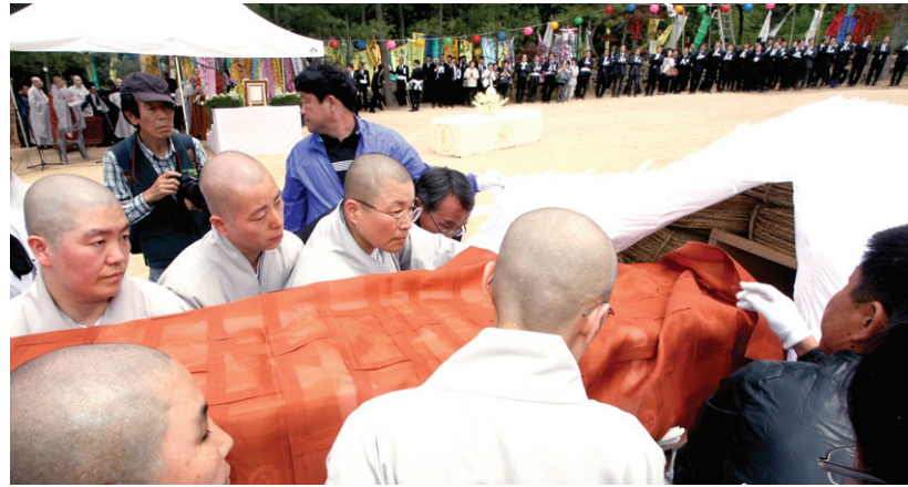
대행 스님의 법구가 연화대 안으로 옮겨지고 있다.