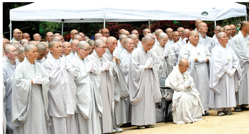
대행 스님의 제자들이 스승님께 마지막 인사를 올리는 듯한 숙연한 모습이다.