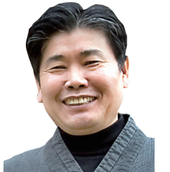
글=정찬주 · 사진=이일선

쿰나하르는 파르나 시민들에게 공원의 역할도 하고 있는 모양이다. 젊은이들이 벤치에 앉아서 데이트를 즐기고 있는 모습이 눈에 띈다. 일행은 마지막에 박물관에 들려 유적지에서 나온 유물들을 살핀다. 전시된 유물들이 초라하다. 중요 유적들은 모두 주립 파르나박물관으로 옮겨갔다고 한다. 일행은 파르나박물관을 다음에 들르기로 하고 바 이살리로 향한다.