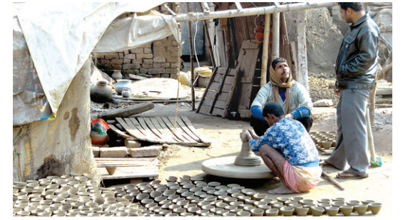
아유왕사 가는 길에 만난 파르나 주민들. 이제 아유왕사 터 일부는 이들의 생활터전이다.

해지고 있다는 법문을 들고는 인도 전역에 8만 4천 개의 사원을 짓기로 결심한 뒤 실제로 그만큼의 전 법사원을 건립했다는 점이다. 아유원사도 그때 짓기 시작하여 3년 만에 회향했던 것이다.