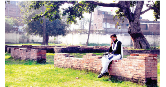
아쇼카왕이 건립한 아유왕사 터 일부. 이곳에서 아쇼카왕은 경전결집, 승단 정화 등 불교 발전에 힘썼다.

첫 번째는 재위 4년에 목갈리뿌따따사 장로로부터 부처님의 가르침이 8만 4천의 법장(法藏)으로 전