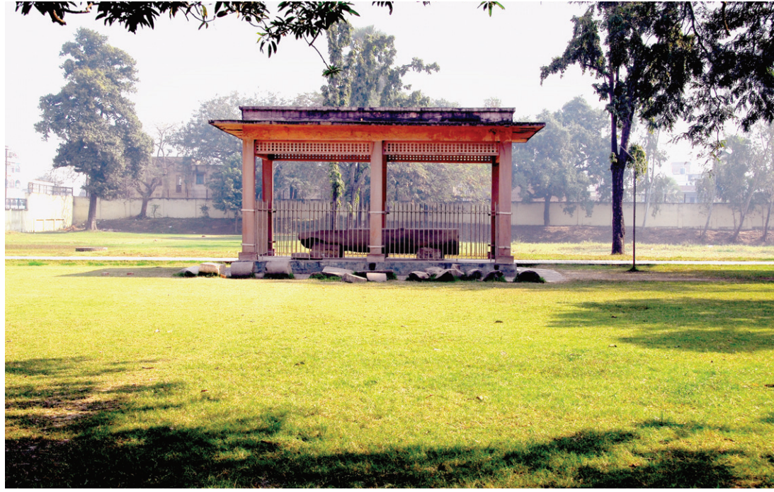
아유왕사 터에 있는 동간 아쇼카 석주. 정복 군주면서도 불교에 귀의해 승단을 정화하고, 생명 존중의 통치 철학을 펼친 아쇼카왕의 통치철학은 현대 정치인들에게도 시사하는 바가 많다.

마침내 불교 장로들은 아쇼카왕 즉위 10년에 더 이상 법회를 열지 않기로 결정했다. 목갈리뿌따따사 장로가 아유원사의 관리를 제자인 마힌다 장로에게 맡기고는 강가강 상류인 아호강가의 동굴로 들어가 버렸다. 이러한 사실은 곧 아쇼카왕에게 보고됐다. 그러나 아쇼카왕은 이교도들을 내쫓지 않고 그들과 함께 포살법회를 하도록 명을 내렸다. 왕의 취지는 여러 종교 수행자들이 서로 화합하라는 것이었다. 그리해 아쇼카왕은 신하를 보내 포살법회를 감독케 하고 왕명을 거부하는 불교 장로는 궁으로 데려와 사형을 시켰다. 나중에는 아쇼카왕의 동생 락수마라 장로가 잡혀왔다. 신하들이 그를 알아보고 아쇼카왕에게 보고하자 왕은 사형을 중지시켰다. 아쇼카왕은 동생 락수마라 장로에게 그간의 사정을 보고 받고는 참회했다. 부처님 법에 의지하여 통치하고자 인도 전역에 8만 4천 개의 사원을 건립했음에도 불