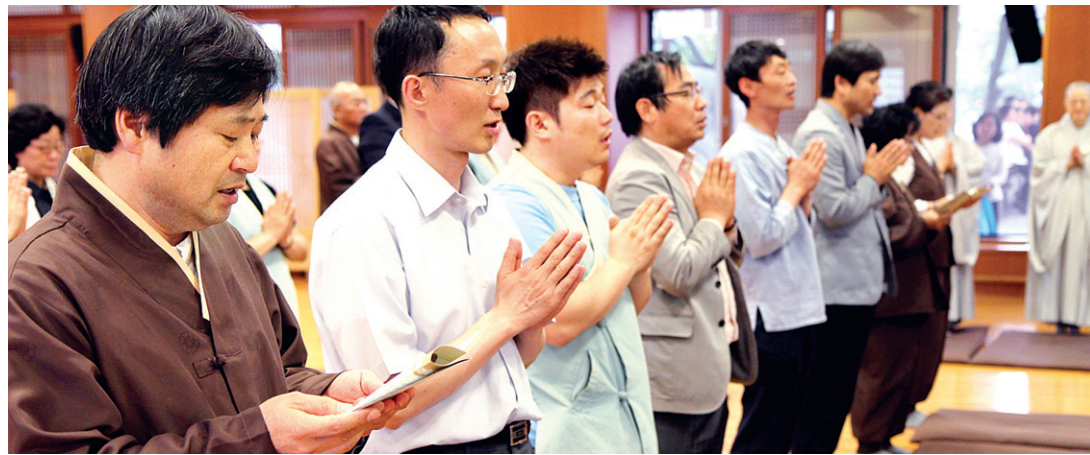
인천 경기지역 포교사 50여 명은 기도를 올리며 스님의 전법원력을 기렸다. 조문 행렬은 밤늦게까지 이어졌다.