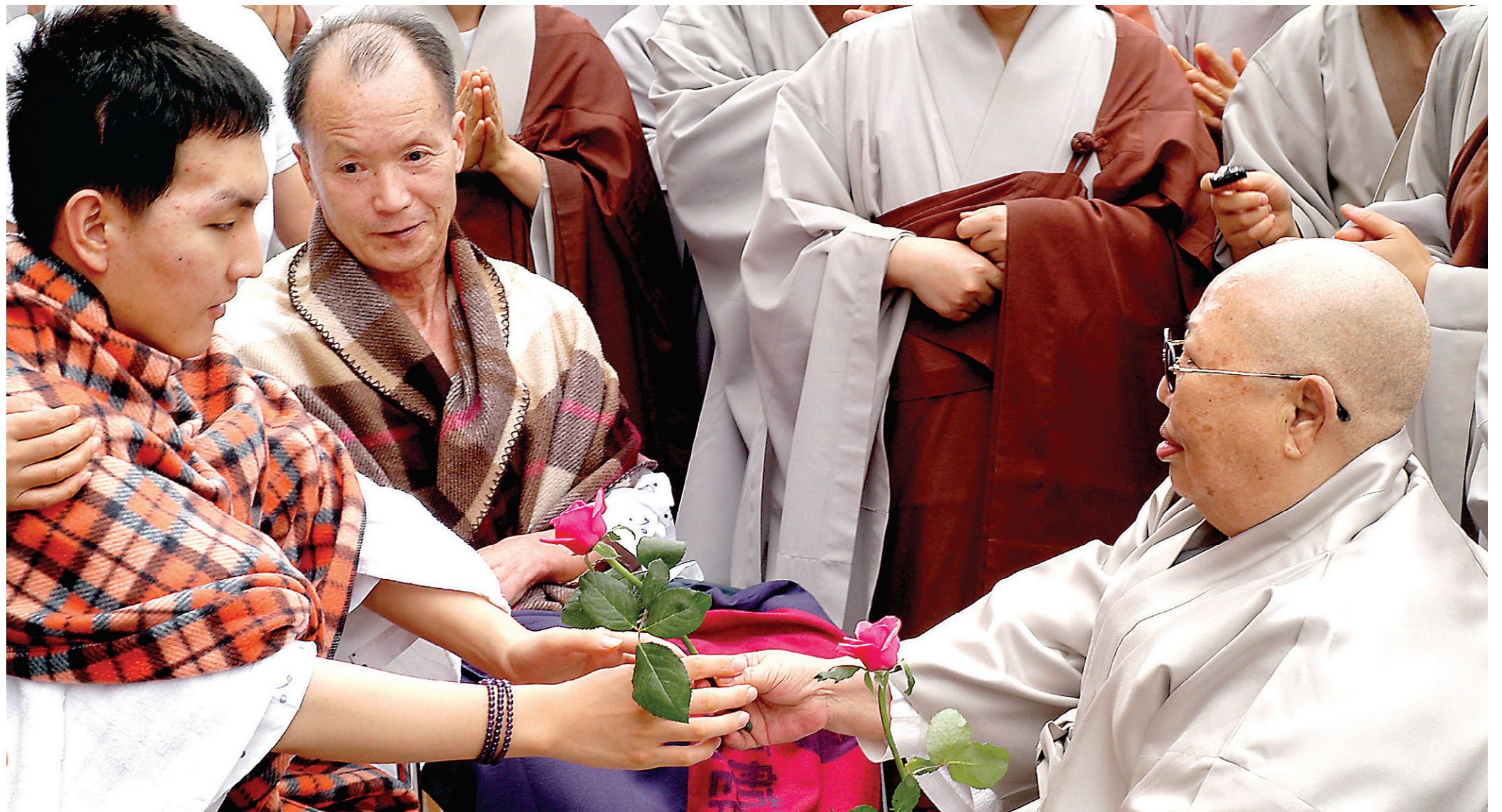
스님은 젊은이를 만나면 젊은이의 마음이 되어 진리를 전하고, 아픈 사람을 만나면 아픈 사람에 맞게 상대와 하나가 되어주었다.