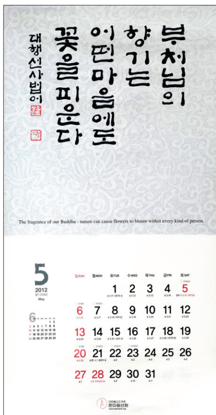
대행 스님이 가신 5월의 달력. ‘부처님의 향기는 어떤 마음에도 꽃을 피운다’는 스님의 법문이 이달의 법향으로 피어나고 있다.

스님이 처방전을 준 사람들이 기적처럼 병고를 벗어나기도 했다. 그러는 가운데 스님 곁에 사람들이 모이기 시작했다. 병을 고치는 등 은혜를 입은 사람들은 스님을 ‘도인’이라고 여기고 받들기까지 했다. 스님은 분명하게 밝혔다. 2면으로 계속