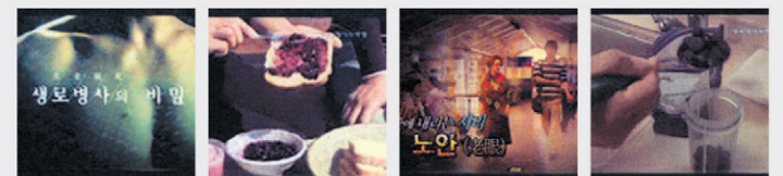
KBS 생로병사의 비밀 '단골 블루베리' 안토시아닌 효능 소개 / 자연이 준 종합영양제 '원리 과일'을 먹어라 / '눈이 내리는 서리, 노년 편 안토시아닌 효능' 2009년 10월15일 방송 / '눈이 내리는 서리, 노년 편 망막색소증'가적용