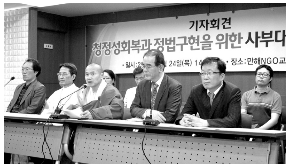
출재가로 구성된 '청정성 회복과 정법구현을 위한 사부대중 연대회의'는 5월 24일 기자회견을 열고 종단 쇄신을 촉구했다.

음을 시사하는 발언도 했다. 스님은 “6월 초에 수많은 관심 속에서 종단 쇄신안을 공포할 예정에 있다”며 “교구본사 주지 스님들의 적극적인 동참과 실천이 무엇보다 종단의 큰 동력이 돼야 할 것”이라고 강조했다. 이어 “지나간 과거의 행동과 사고방식으로는 한국불교의 미래를 열어가질 수 없다”며 “지금의 고통의 시간을 미래 성장의 토양으로 삼자”고 당부했다.